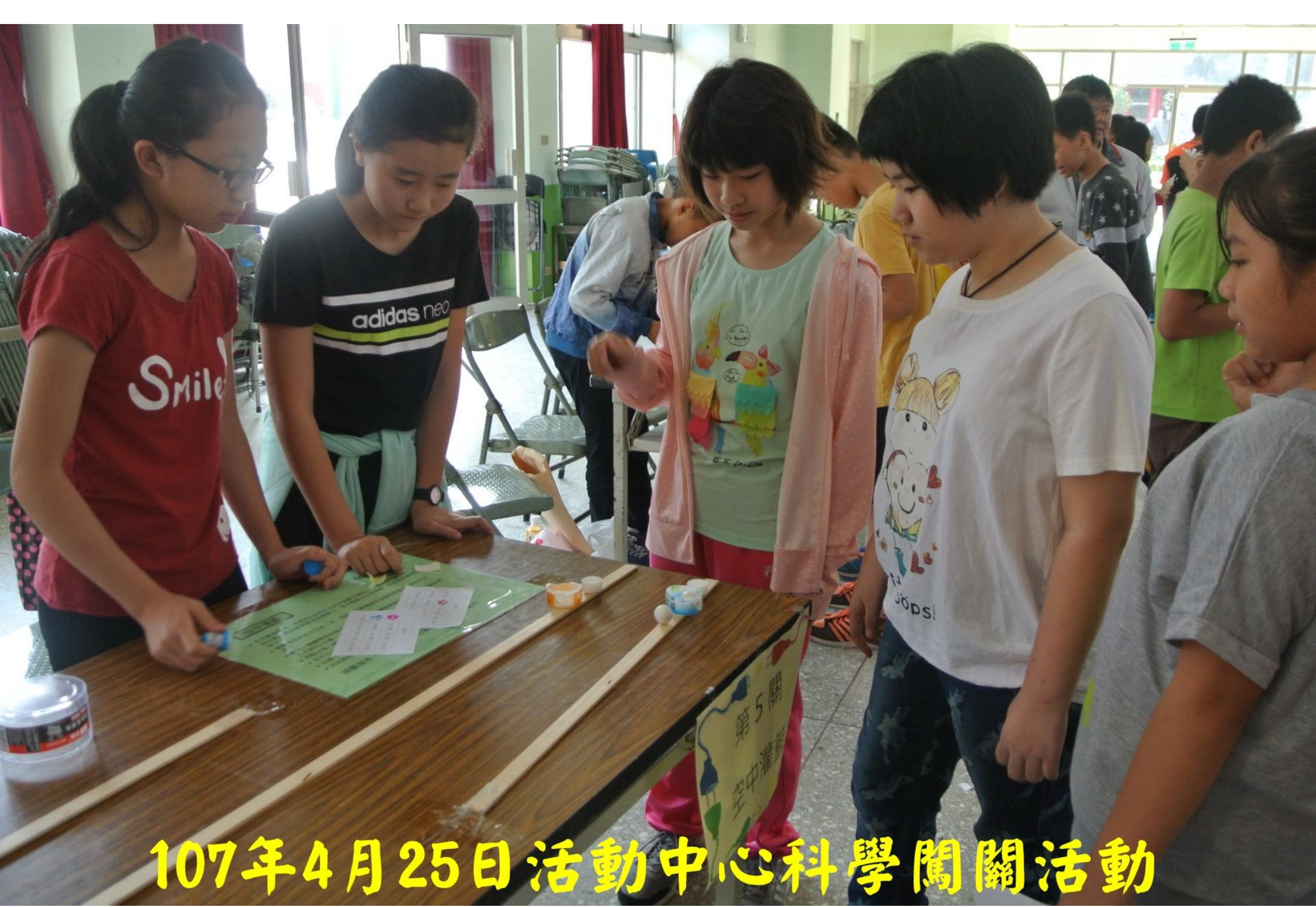
107年4月25日活動中心科學闖關活動