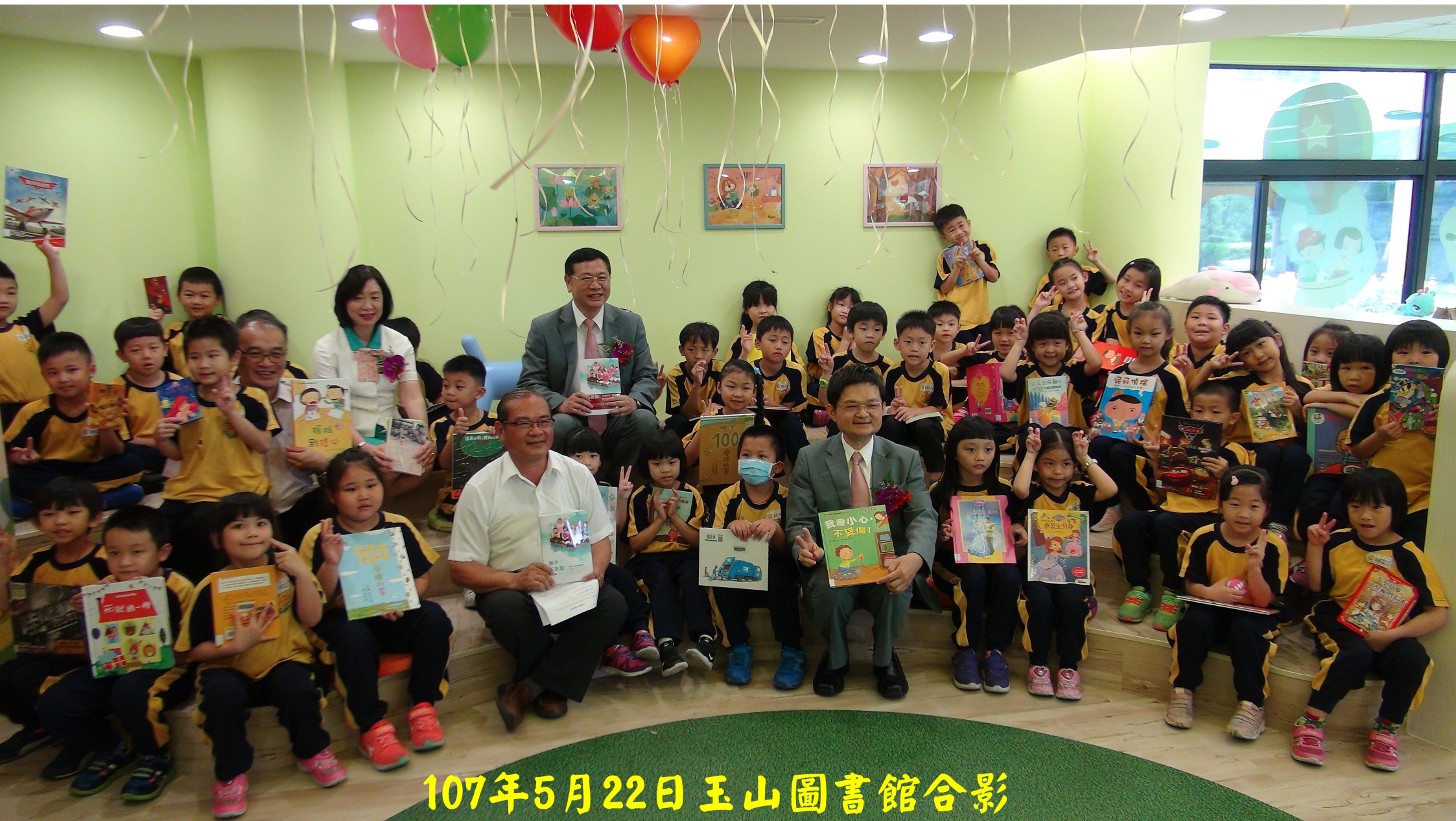
107年5月22日玉山圖書館合影