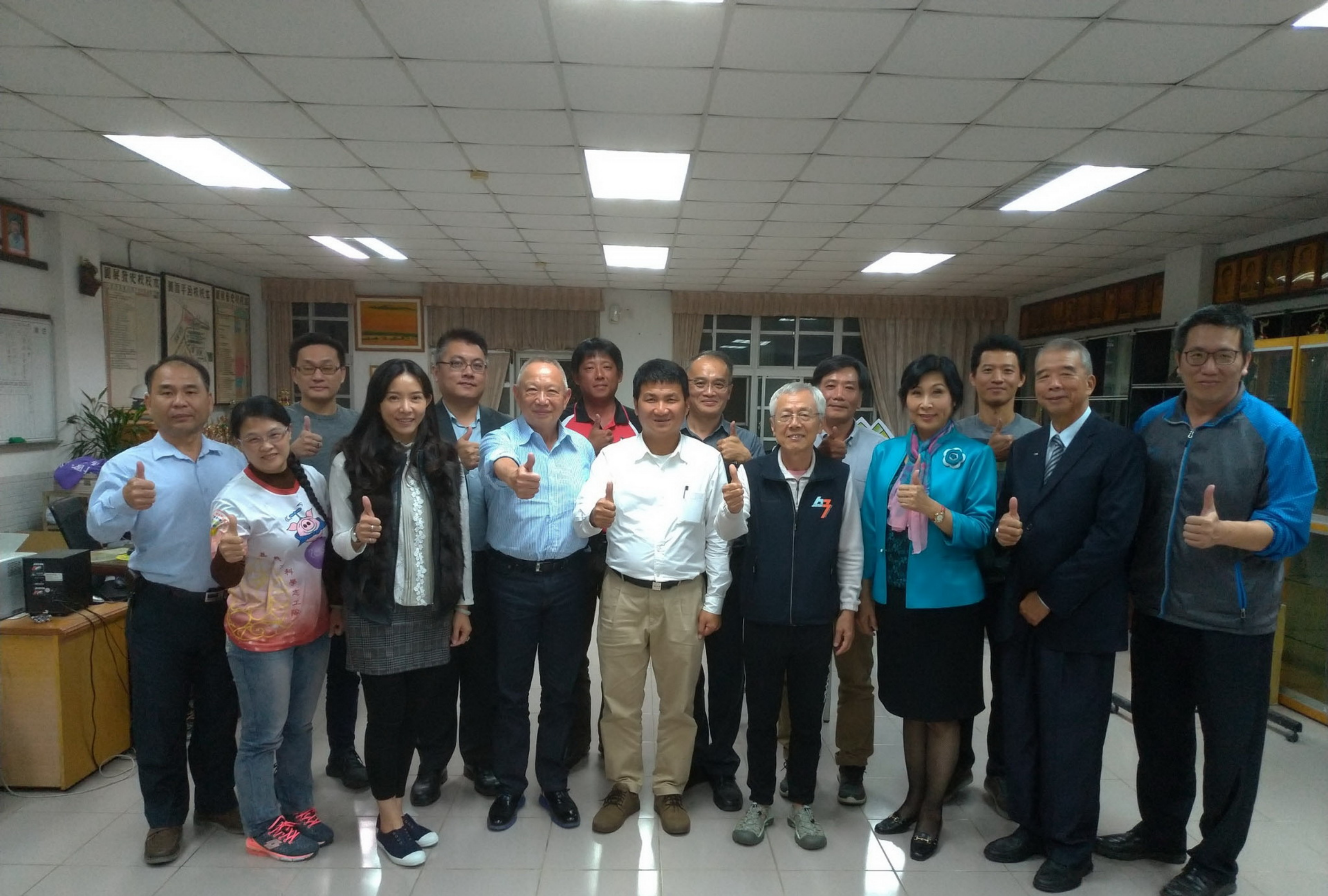
107年12月14日百年校慶籌備會合照