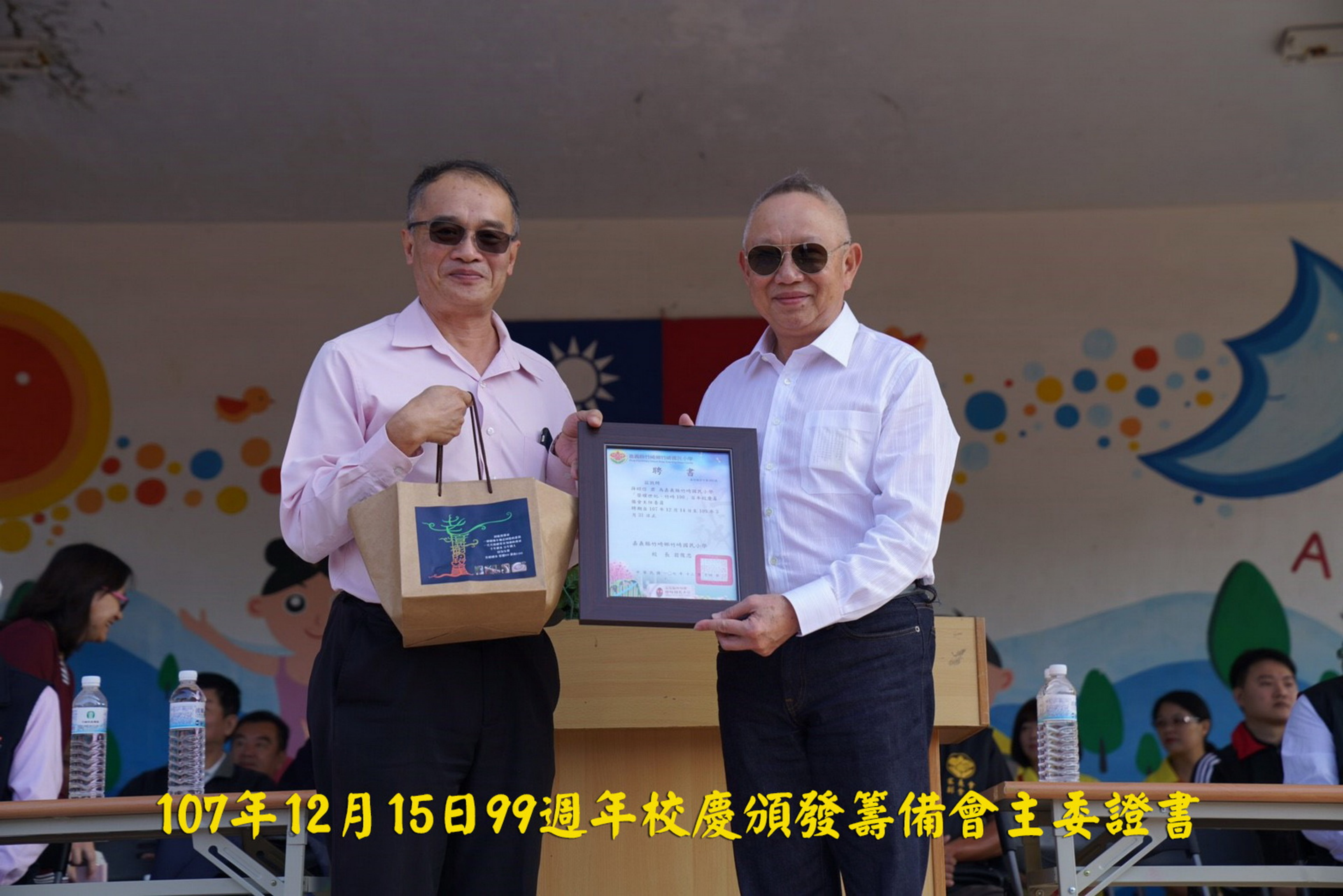
107年12月15日99週年校慶頒發籌備會主委證書