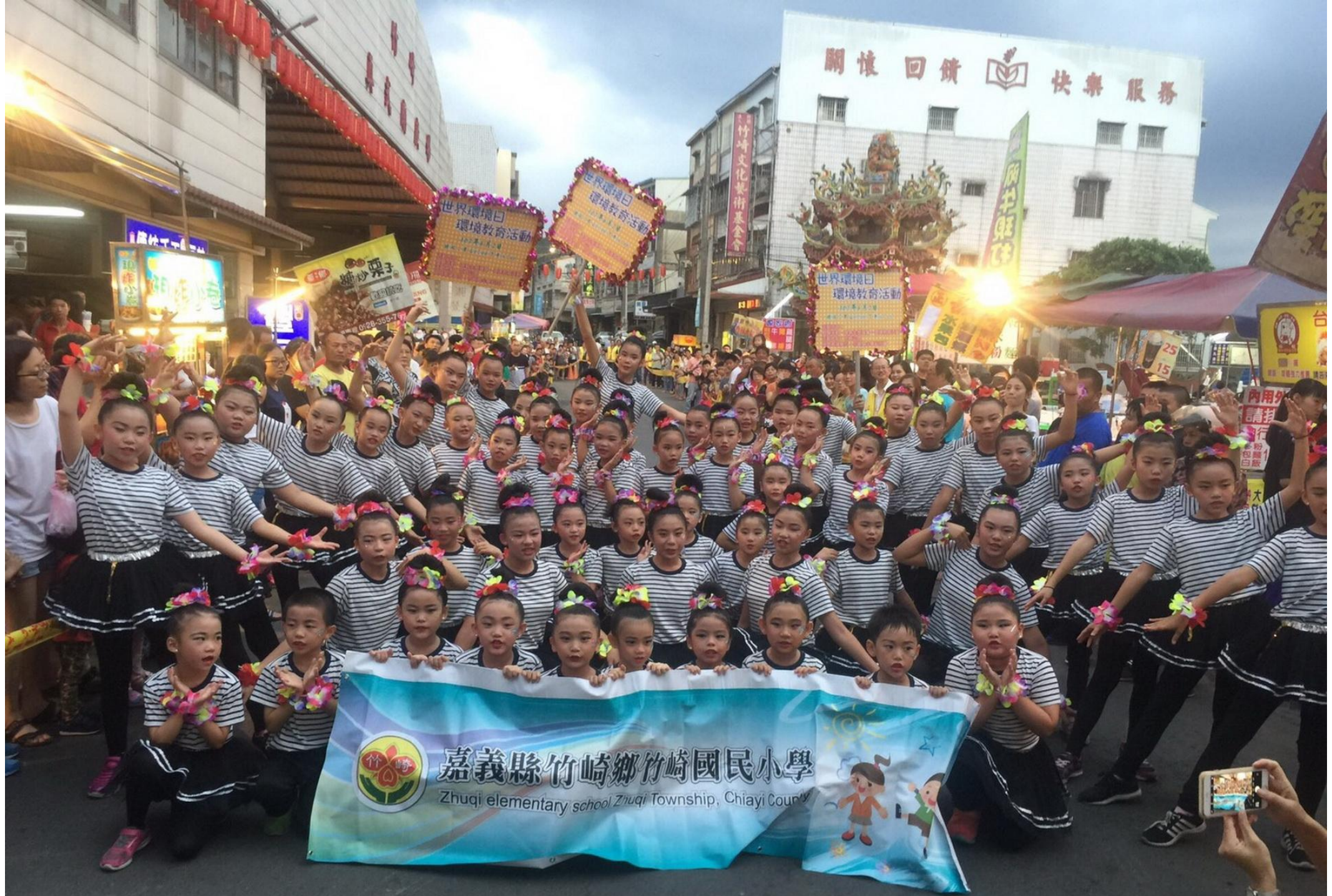
107年5月30日世界環境日竹崎夜市快閃活動