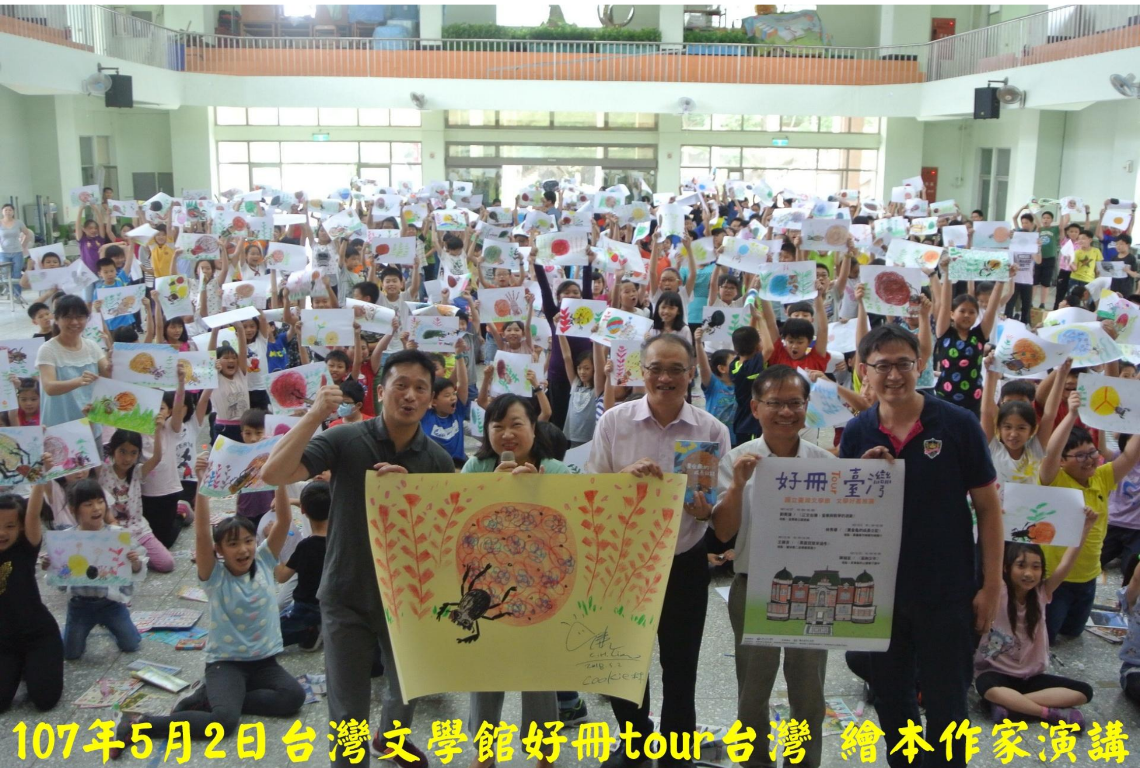
107年5月2日台灣文學館好冊tour台灣繪本作家演講