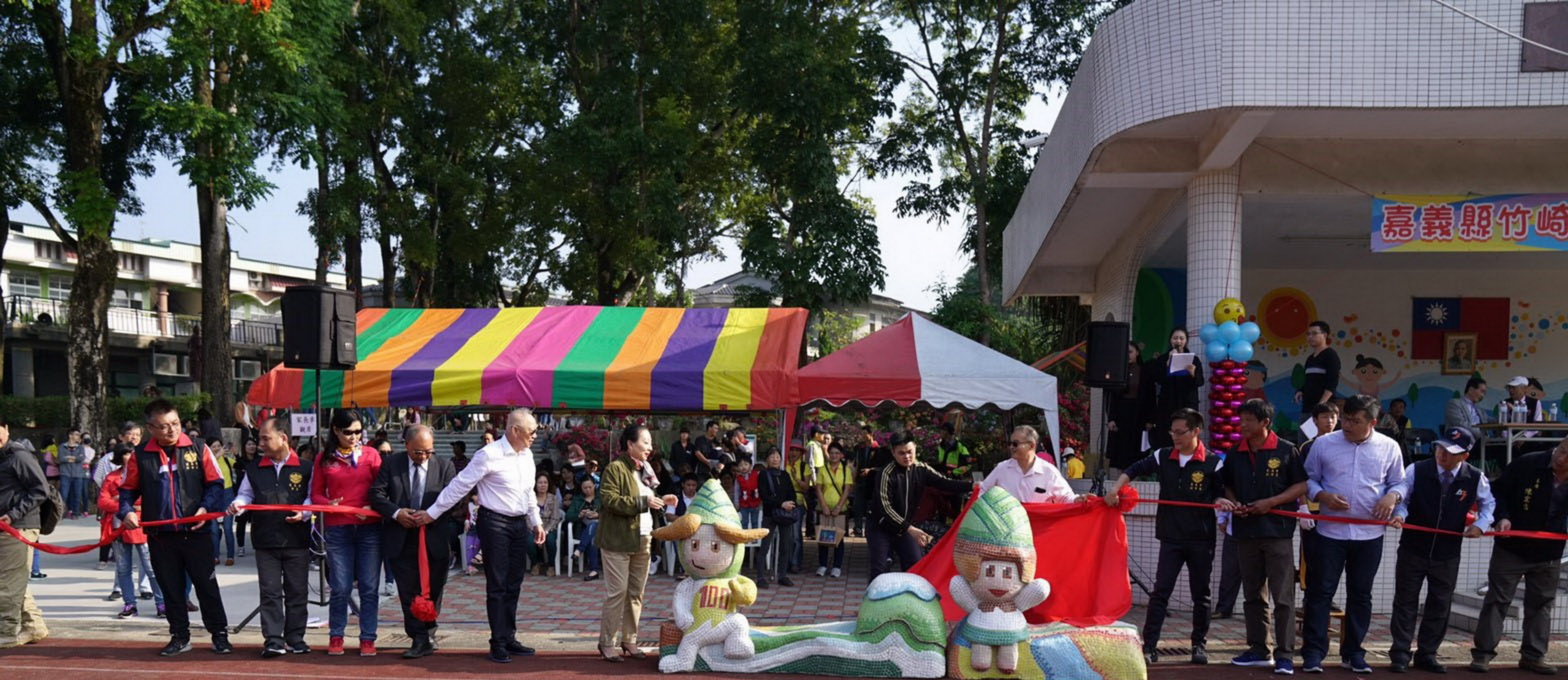
107年12月15日99週年校慶造型公仔座椅