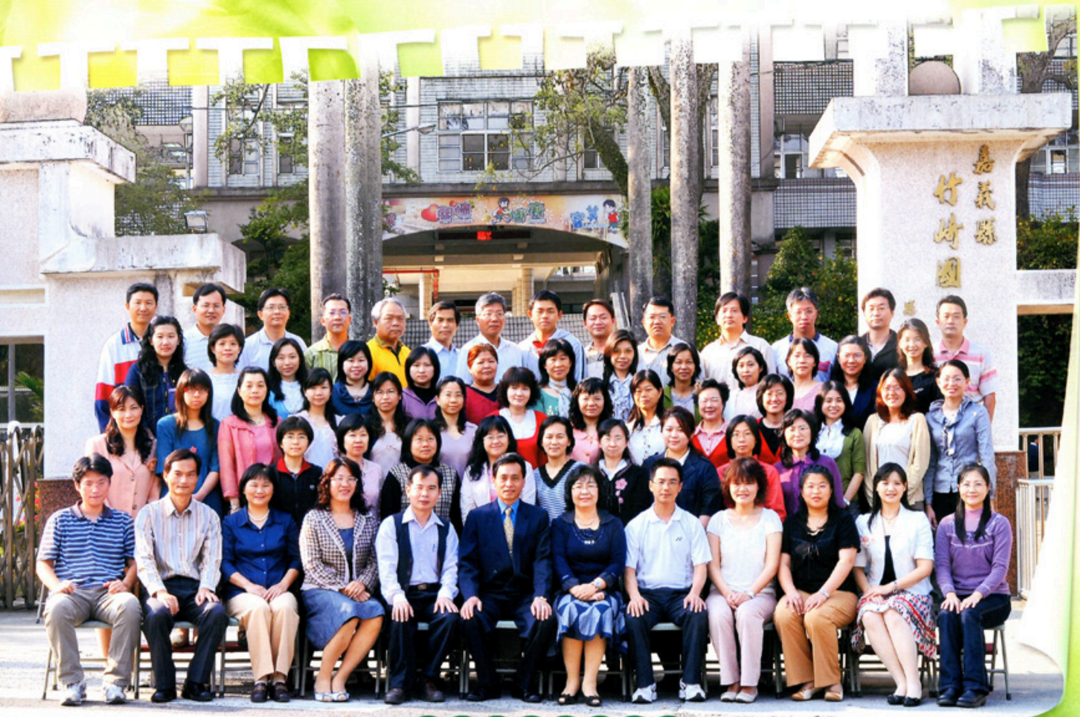
全體教職員工合照