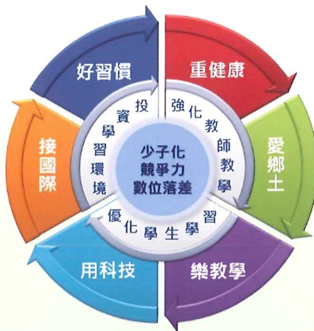
圖 1：嘉義縣 創新教育白皮書 架構圖