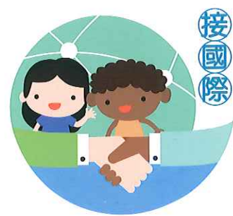
圖 3：嘉義縣 教育行動目標 圖像