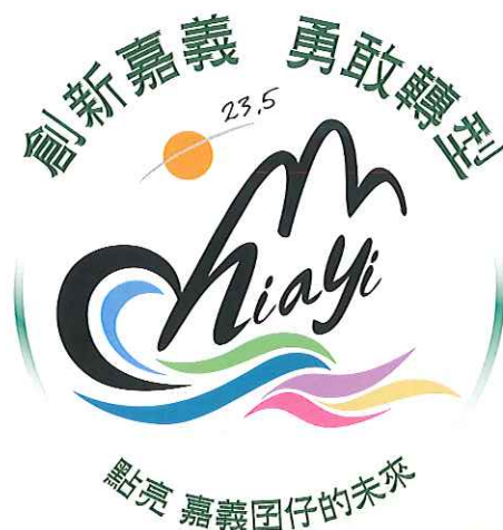
圖 2：嘉義縣 教育願景 圖像

少子化的時代，每位家長都關心小孩教育的質量，現今教育的目的，是讓孩子在競爭的社會中站穩腳步向前行，讓學子在快速發展的科技時代中善用科技，我們現在要努力的方向是，在建構一個良好的學習環境，給他們最好的引導教師，點亮他們的興趣及專長，讓每一個嘉義囡仔，未來都可以發光發熱。